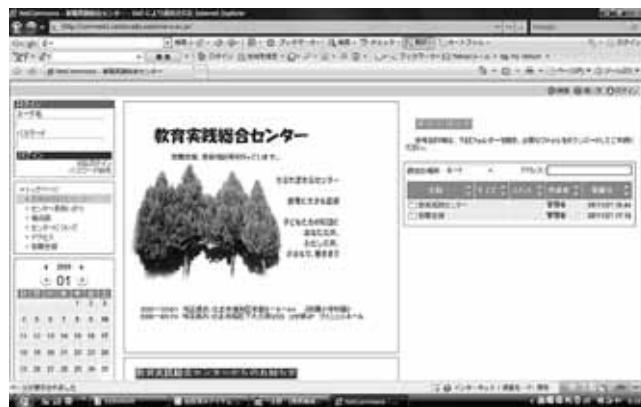
(試作中のホームページ)

学校現場と大学の学びをつなげるツールとして、あるいは教育実践総合センターが行う事業の効率化を図るツールとして、ホームページの活用研究を始めています。学校フィールド・スタディ、現職教員との交流、教職を目指す学生との学習相談、センター紀要論文の公開等、どんな活用が可能なのかを今後研究していきます。