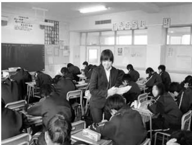
(中学校にて学習支援を行っているところ)

本年度は、学びのフィールドを高校まで広げ、幼稚園・保育所、小・中学校も含め、学生のニーズに応じた体験の場の充実を図りました。履修予定の学生への説明会の実施や体験を学びに高めるために事前指導、中間授業、振り返り授業を行いました。さらには学生の活動状況を配置先の学校訪問を通じて把握し、内容の充実に努めています。